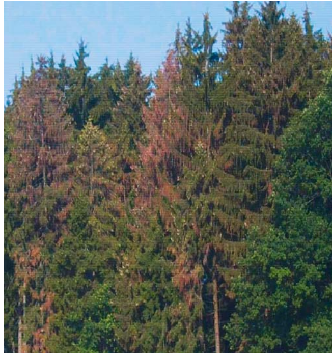
Verfärbung von Fichtenkronen nach Borkenkäferbefall