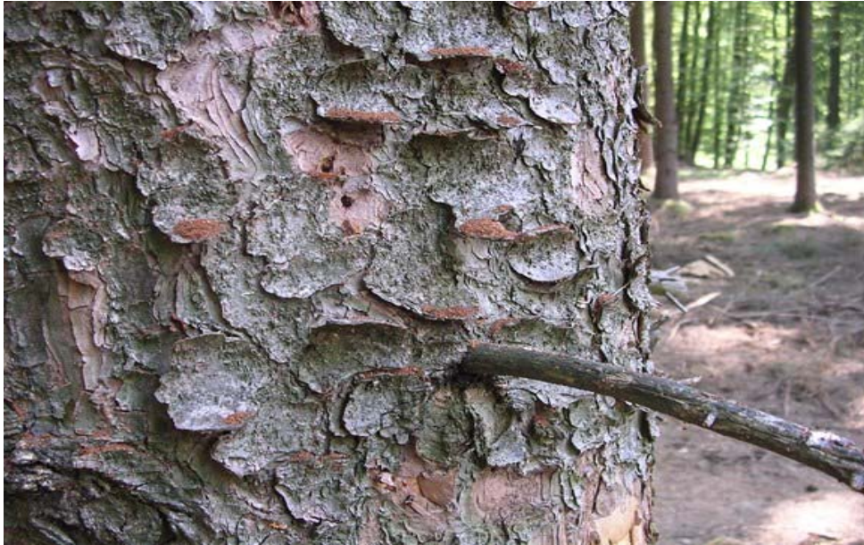
Buchdrucker- bohrmehl auf Rindenschuppen