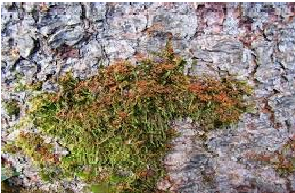
Buchdrucker- bohrmehl auf Moos an Fichten Stammfuss