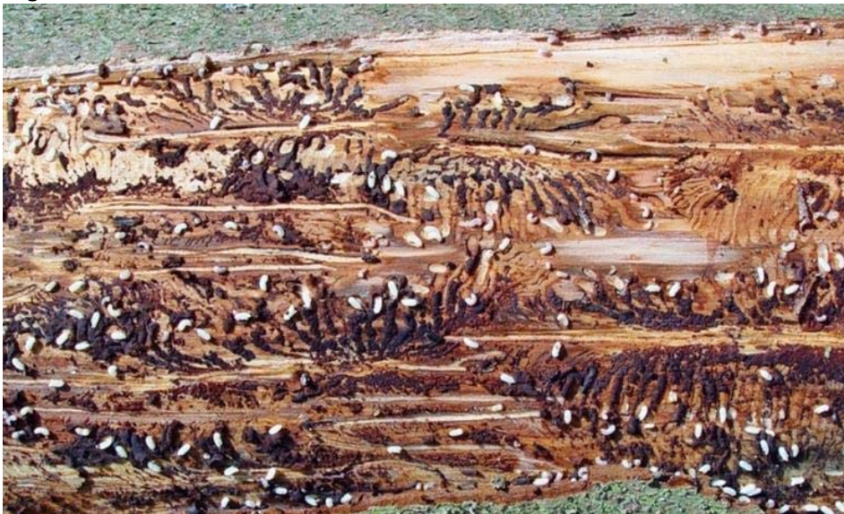
Buchdruckerlaven im Entwicklungsstadium «Weiss»